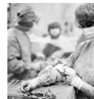
Scrub nurse preparing instruments

Articles in this Journal may not be reprinted without the express written permission of ORNAC. Contact www.ornac.ca .