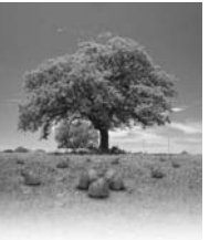
ORNAC Conference May 1-6

Articles in this Journal may not be reprinted without the express written permission of ORNAC. Contact www.ornac.ca .