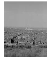
Montreal Home of ORNAC 19th National Cover Photo by J. Porteous

Articles in this Journal may not be reprinted without the express written permission of ORNAC. Contact www.ornac.ca .