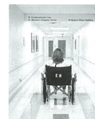
Walk or be Driven?