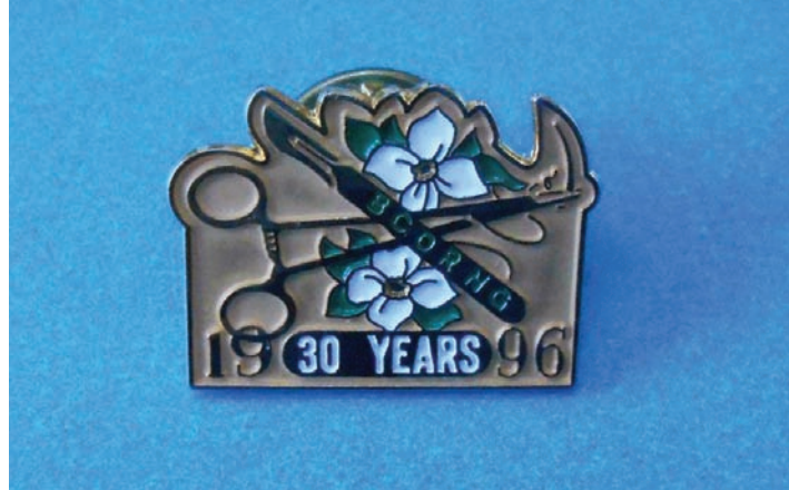
L'épinglette du 30e anniversaire du BCORNG présentée aux anciennes membres du comité exécutif et aux membres fondateurs.

le site Web pour la C.-B. à ce moment. Notre adresse était www.ornac.ca/bcorng.htm . Plusieurs autres provinces ont aussi embarqué, et à cette époque, je crois que pour les premières années, il n'y avait aucun frais pour le site Web des provinces. » (communication personnelle, 2014)